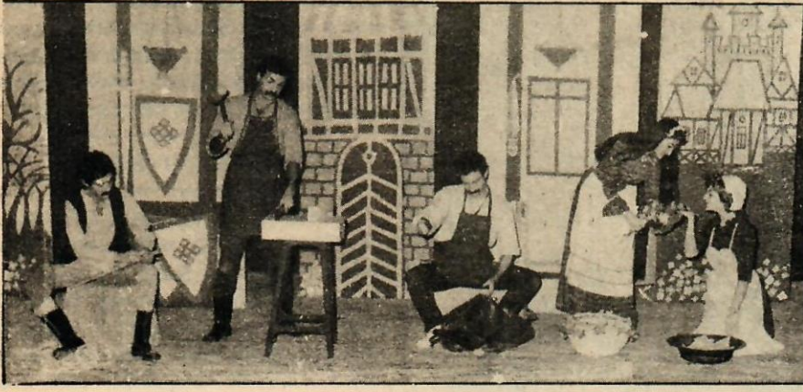
AST: Sihirli giysi