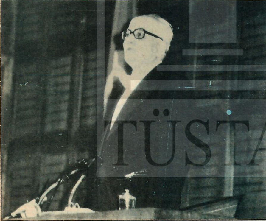
Sadi Irmak, Danışma Meclisi Başkanı

numaralı odada çalışacaklardır. Saat 11'de ilk toplantılarını yapmalarını rica