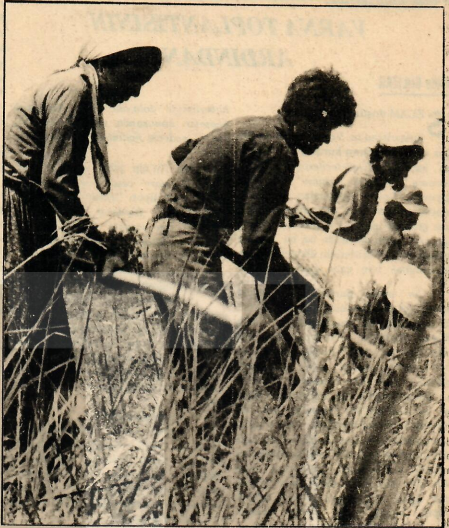
Çiftçi; gübre ve tarımsal ilaç kullanamaz durumda

1980'den bu yana, destekleme fi- ARAYIŞ-7 KASIM 1981