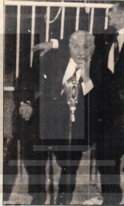
Erbakan, tu tuksuz yargılanıyor

● Anayasal düzenin, Cumhuriyetçilik ve Demokrasi prensiplerine aykırı olarak, devletin tek bir kişi tarafından yönetilmesi amacıyla yönelik, değiştirilmesine zor yoluyla kalkışmak;