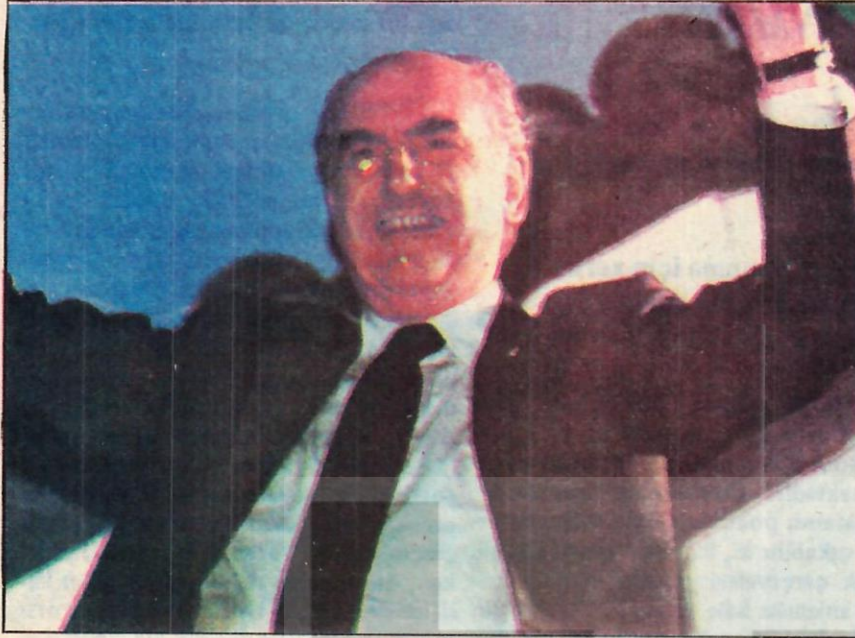
Papandreu: Amacı ne?

"Ulusal güvenlik ve bütünlüğümüze karşı Türkiye'den yöneltilmiş bir tehdit mevcuttur. Türkiye'nin talep, tahrik ve davranışları amaçları konusunda hiçbir şüphe yaratmamaktadır..."