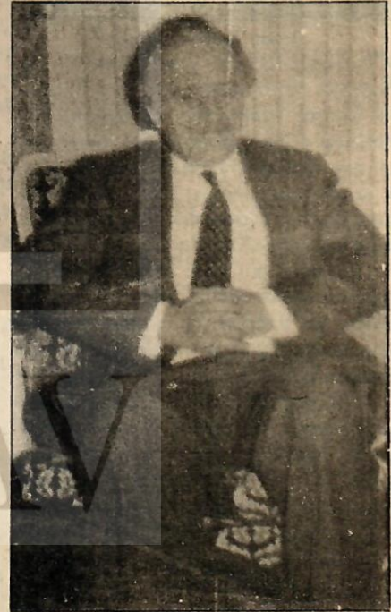
Erdem, "Kumar oynandı"

Maliye Bakanının deyimiyle, kuşkusuz bir bölümü "kumara", yani, bankerlere gidiyor. Bankerlerden nereye gidiyor, onu biz bilemiyoruz. İl-