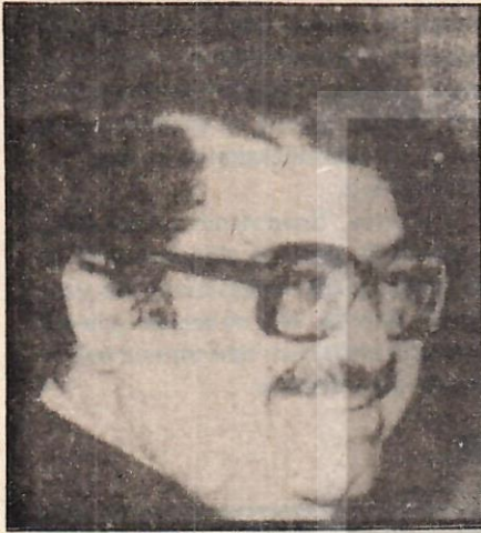
Özal "İster tıkrında"

C UMHURİYET gazetesinin 24 Ekim 1981 günlü sayısının Ekonomik Yaşam bölümünde, ilk bakışta birbirleriyle çelişir gözükürken iki haber yer alıyordu. Haberin birinde, buzdolabı ve TV stoklarının arttığı, ötekinde de TV fiyatlarına 1 Kasım'dan itibaren zam yapılacağı bildiriliyordu.